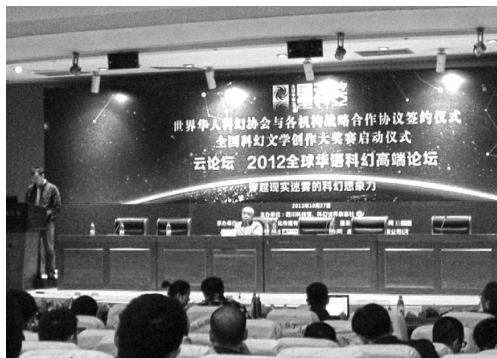
(2012. 10. 27, 成都)