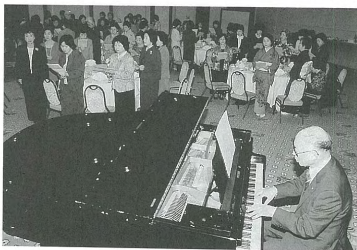
同窓生一同による校歌斉唱