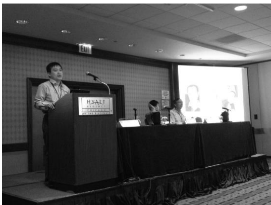
図2 アメリカでの世界SF大会における中国 SF 企画の様子(発表者:呉岩 教授)

(6) アメリカで開催された世界 SF 大会に参加し、中華圏 SF についての発表を聞くと同時に、欧米で勢いを増している華僑作家について調査、取材した。それらの結果は紀要に発表した。